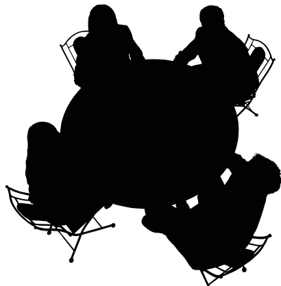
Källa: Kontorsbarometern 4, 2009, Vasakronan

kontorslandskapet kan medarbetarna prata utan att störa de som sitter och arbetar.