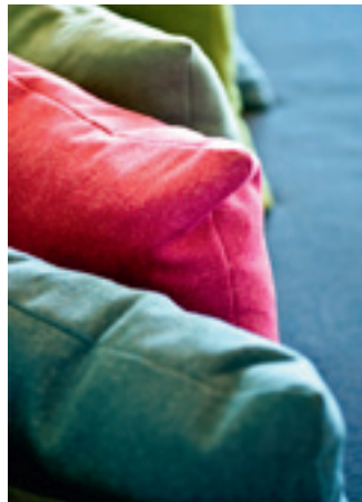
Mjuka puffar och mysiga kuddar bjuder in till spontana möten.