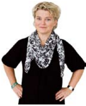
Anneli Burman Arkitektur & Design, MER Tel 08-658 79 04